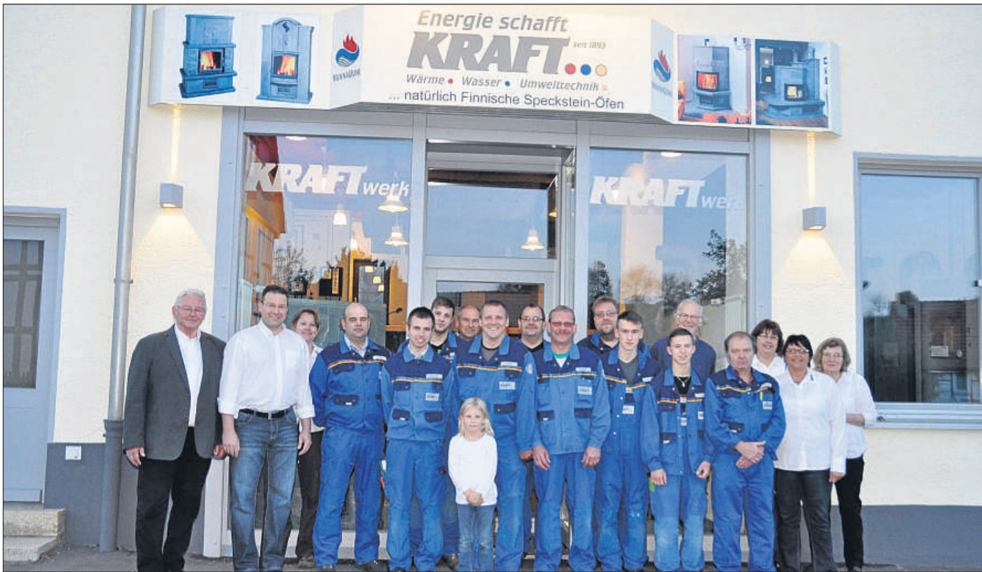
Das gesamte Team der Kraft GmbH & Co. KG: Es steht den Kunden in allen Belangen des Heizungsbaus, der regenerativen Energietechnik, bei Badinstallationen sowie Ofen- und Schornsteinbau zur Verfügung.